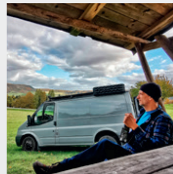
VANTRAVEL = Auszeit an den schönsten Plätzen