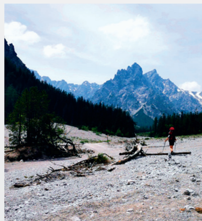
AUF DEM WEG zur Wimbachgrieshütte auf 1327 Metern

»Ausgecheckt« – der Blog: www.ausgecheckt.blog